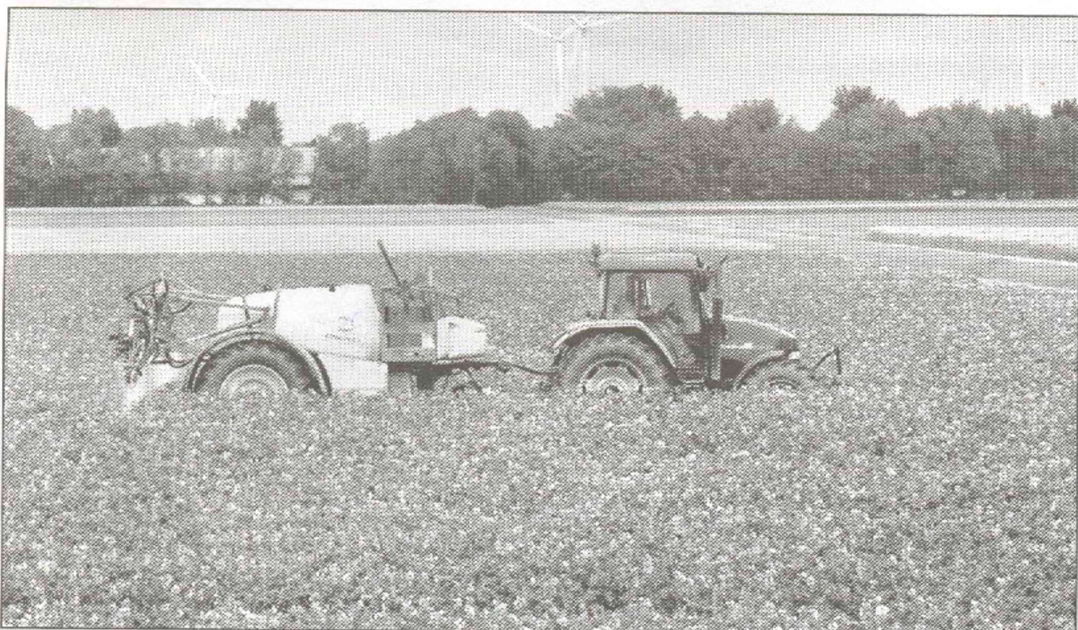
Dacom waarschuwt telers wanneer ze moeten spuiten.